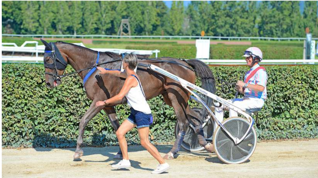
Le monde des courses de trot, un milieu à part que le public a pu découvrir à Avenches.

Au cœur du village des exposants, le cousin du cheval a également fait des émules au travers de